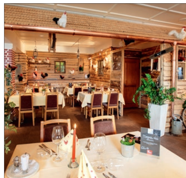
Von Mittwoch bis Sonntag im Güggeli-Sternen für Sie da.